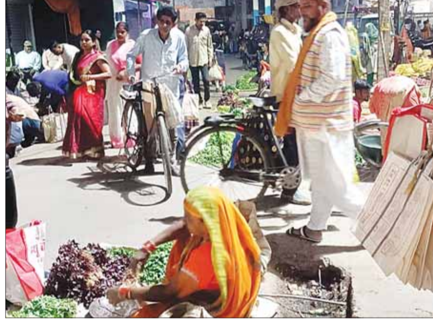
जिससे भोले भाले सब्जी विक्रेताओं का अस्तित्व बरकरार रहे। पुलिस प्रशासन इस ओर ध्यान दें।